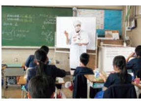
▲食育・自校給食(和を中心とした手作りの給食)