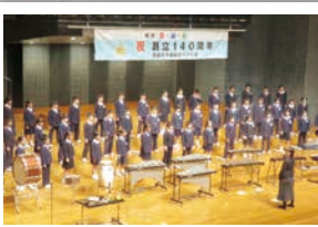
▲「愛・誠・勇」音楽祭