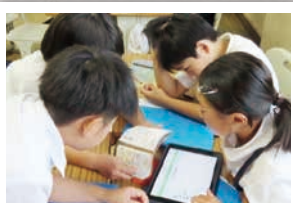
▲ICTによる情報活用能力の推進

関係機関、PTA、地域の皆様の協力を得ながら 子どもの資質・能力を育むことを目指して様々な取組を実践しています。