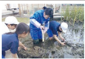
▲生活科・総合的な学習の時間の伝統