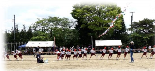
平田っ子スーパー綱引き（全校生）