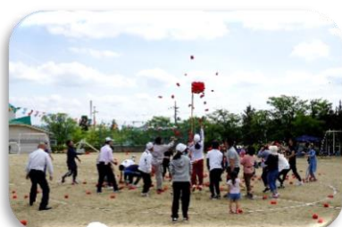
紅白対抗玉入れ(保護者)