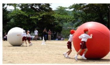
大玉ころがし(1・2年)