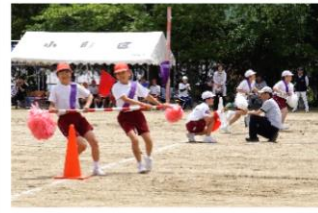
平田タイフーン(3・4年)