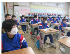
全校放送を真剣に聞いている6年生

ご家庭においてもこれを機会に、震災や防災の事について話題にしてはいかがでしょうか。