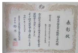
教育公務員弘済会 奨励賞