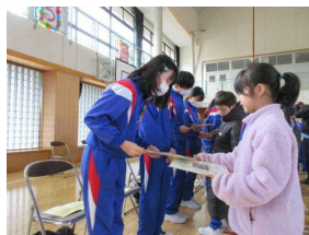
在校生から6年生へ感謝のプレゼント

3月6日(木)に全校生で6年生を送る会を行いました。4、5年生の実行委員が中心となって、各学年で花飾りやプレゼント作りなどの準備を進めてきました。当日は縦割り班対抗でじゃんけんゲームなどを楽しみました。また、在校生からは一人一人がメッセージを書いた色紙とメダルのプレゼントもありました。とても心温まる送る会でした。6年生からはお礼のしおりのプレゼントやダンス披露がありました。6年生はいよいよ卒業に向けてカウントダウンです。