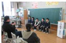
2年生は地域の方から教えていただいた飯野の民話を発表しました

これまで、保護者の皆様には多くのPTA活動にご協力をいただきましてありがとうございました。おかげ様で各委員会で予定されていた活動を計画通り実施することができました。また、PTA会長様をはじめ本部役員の方々には、お忙しい中PTA活動の様々な場面で献身的にご尽力をいただきました。改めて深く感謝申し上げます。ありがとうございました。