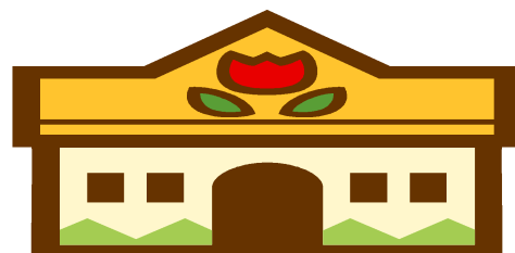
いいの認定こども園