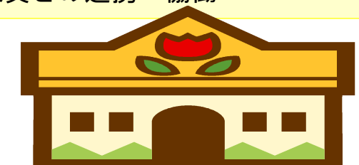
飯野あおぞら保育所