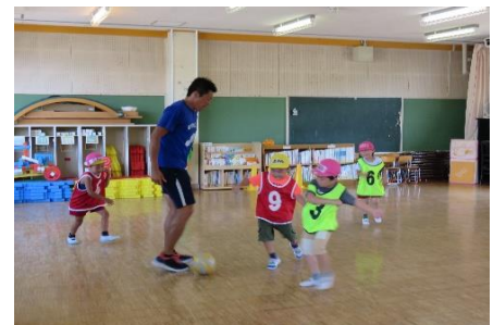
みんな 元気にボールを追いかけ みんな ニコニコ😊