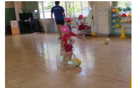
りんごチーム（ピンク）とバナナチーム（黄）に分かれて ゲーム♪