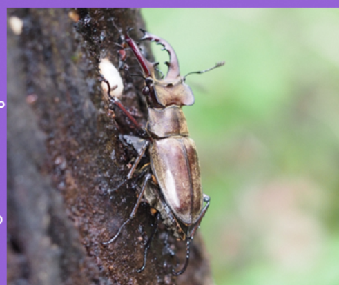
↑ 樹液にやってきたミヤマクワガタ

ですが、実はクワガタムシ観察の最盛期になります。えっ？夏休みの頃じゃないの？と思う方も多いと思います。しかし6月中旬から7月上旬ぐらいまで、つまり夏休みが始まる前が一年で一番クワガタムシが見られる時期なのです。これはクワガタムシの成虫のエサとなる樹液が関係しています。樹液とは植物の水分。植物の体にたっぷり水分があるとたっぷりの樹液を作ることができます。梅雨は毎日のように根から水を吸収できるのもってこいですね。また、梅雨が明けて暑い時期になると、植物は枯れないように水分をたくさん根から吸い上げるようになります。これも樹液を作る材料になります。クワガタムシは樹液のピークに合わせて成虫になるのです。森の中で甘酸っぱい匂いがただよってきたら樹液が近い証拠。クワガタムシを見つける大ヒントになります。