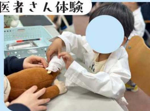
い しゃ たいけん お医者さん体験