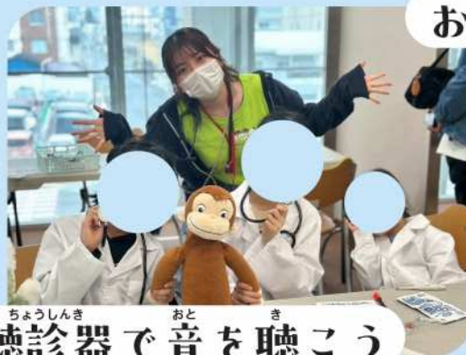
ちょうしんき おと き 聴診器で音を聴こう