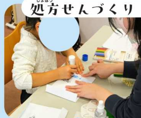
しょほう 処方せんづくり