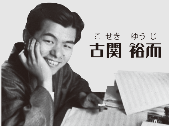
こ せ き ゆ う じ 古関 裕而