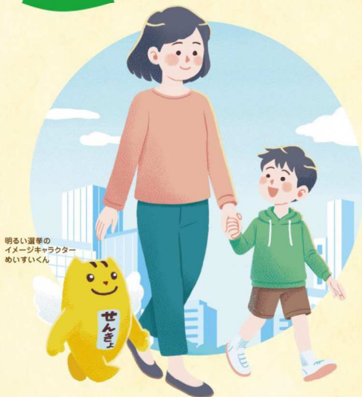
明るい選挙の イメージキャラクター めいすいくん

日本の選挙権は18歳から。 子どもの頃に親子で一緒に 選挙に行った経験があれば、 選挙に行きやすくなりますよね。 私たちの暮らしに つながる政治と選挙。 子どもたちの将来のためにも、 その大切さを子どもたちにも 伝えていきましょう！