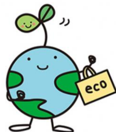
福島県地球環境保全キャラクター 「エコたん」