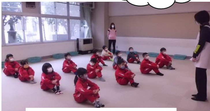
＜ミニ保健指導のお話をしっかり聞く2年生＞

本校では、発育測定に合わせてミニ保健指導を実施し、健康を自分ごとにとらえることができるよう働きかけています。今回は、奇数月に実施してきた健康生活チャレンジカードの11月分の分析結果を伝え、