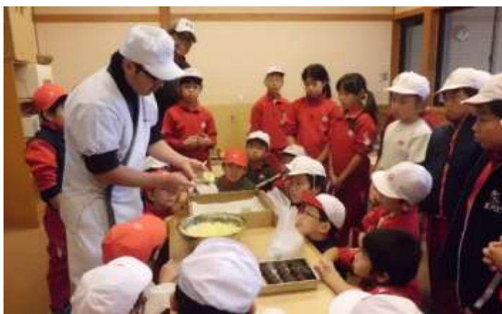
＜ あわまんじゅう 上手に作れるかな ＞

学習発表会でもご覧いただいたように、社会科や総合的な学習の時間において、4年生は「福島県を学ぶ」学習を、また、3年生においても「福島のよさを知る」地域学習を進めているところです。11月6日、広域で各地方の特徴を持つ福島県をより深く学ぼうと、南会津地方の自然や文化、歴史、人々の暮らしに触れる「只見線学習列車」を活用した体験学習を行いました。この只見線学習列車事業は、福島県が奥会津振興のために実施しているもので福島県が一切を負担します。