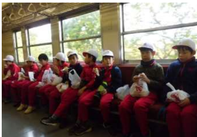
＜只見線列車からの素晴らしい景色も御馳走でした＞

柳津では、災いに会わないように参拝者に配ったという「あわまんじゅう」を手作りし、福満虚空蔵尊園蔵寺へ参拝、素晴らしい只見川の紅葉を眺めながら只見線列車で特製弁当をいただくなど、大変充実した体験学習でした。今後の学習の深まりが楽しみです。