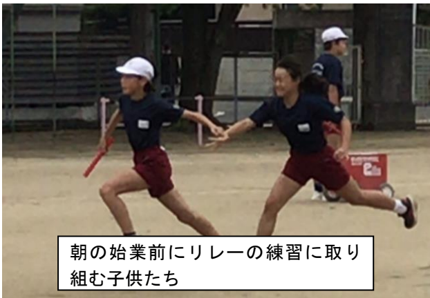
朝の始業前にリレーの練習に取り組む子供たち

また、10月17日には、一学期にできなかった運動会を予定しています。そして、それに併せて、鼓笛隊の演奏も披露します。5・6年生は、運動会に向けて昼休みなどを利用して鼓笛の練習を頑張っています。運動会当日には、素晴らしい演奏を披露することができると思います。ご期待ください。