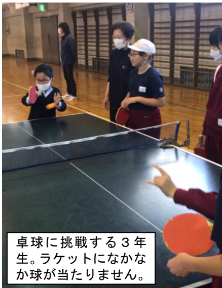
卓球に挑戦する3年生。ラケットになかなか球が当たりません。

11月19日は、5・6校時続きのクラブ活動でした。今回は、来年度クラブ活動に加わる3年生が見学しました。3年生は、5つのグループに別れ、それぞれのクラブ活動の様子を見学しました。クラブによっては、見学だけでなく、体験させてくれるクラブもあり、3年生は楽しく参加できたようです。3年生からは、「来年は、どのクラブに入るか決めた!」「どのクラブも楽しそうで、どれに入るか迷ってしまう」などの声が聞かれました。来年4月が待ち遠しいといった3年生の意欲的な姿が見られました。