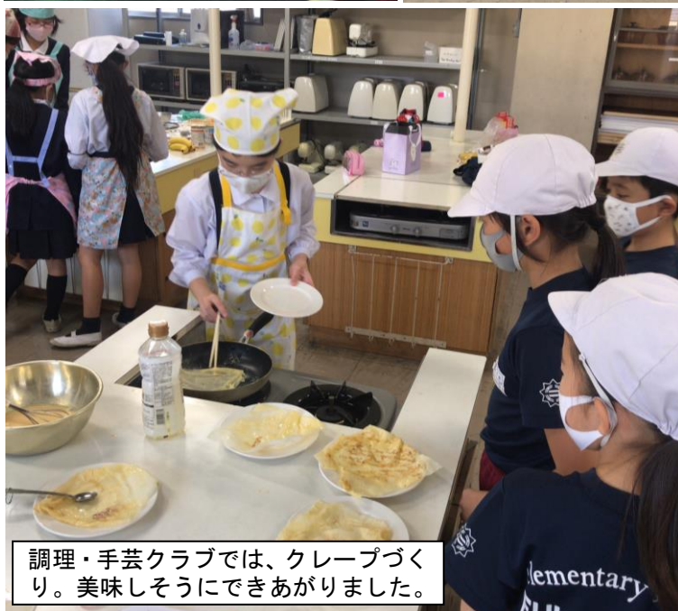
調理・手芸クラブでは、クレープづくり。美味しそうにできあがりました。