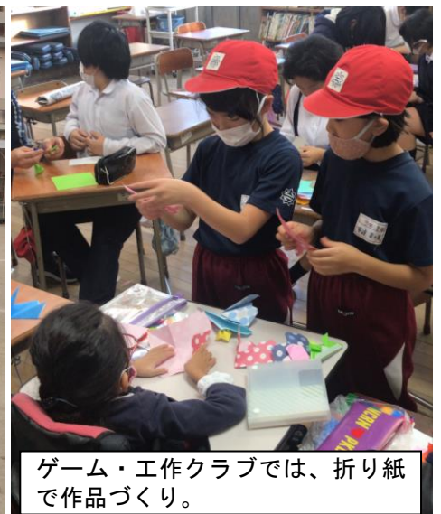
ゲーム・工作クラブでは、折り紙で作品づくり。