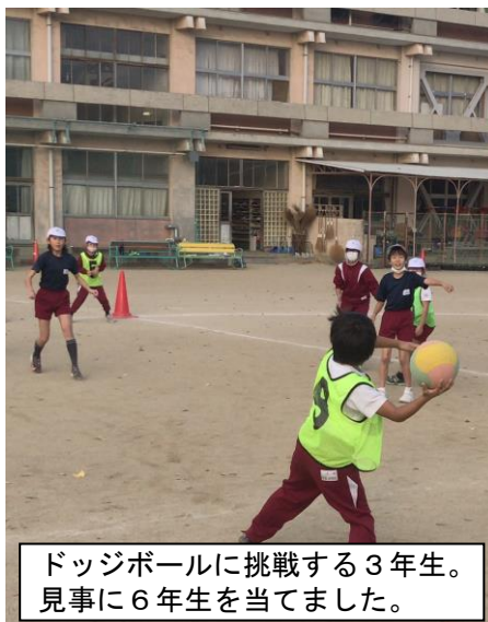
ドッジボールに挑戦する3年生。見事に6年生を当てました。