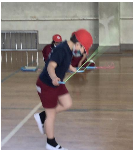
1年の・・・くんです。かけ足跳びに挑戦です。

改めて、今年のなわとび記録会を振り返ってみると、どの学年の子どももめあてに向かって一生懸命に取り組みました。めあてを達成した喜びを味わうことはもちろん、なわとび運動を通して、粘り強く、最後まで取り組むことの大切さにも気付いてくれたと思います。「継続は力なり」という言葉があります。なわとび運動の取組は正にそのことを実感させてくれます。そして、そのことはその他の学習にもつながります。これからも子どもたちの頑張りを見守っていきたいと思います。