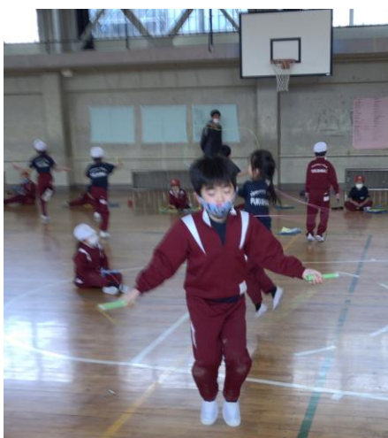
2年の・・・くんです。後ろ跳びに挑戦です。