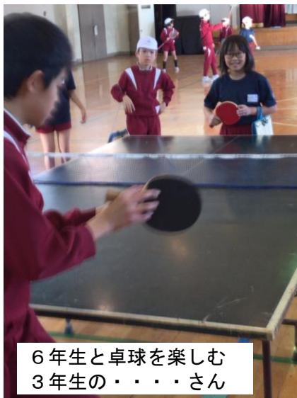
6年生と卓球を楽しむ 3年生の・・・さん

11月21日は、5・6校時続きのクラブ活動です。今回は、来年度クラブ活動に加わる3年生が見学しました。3年生は、6つのグループに別れ、それぞれのクラブ活動の様子を見学しました。クラブによっては、見学だけでなく、体験させてくれるクラブもあり、3年生は楽しく参加できたようです。3年生からは、「来年は、どのクラブに入るか決めた!」「どのクラブも楽しそうで、どれに入るか迷ってしまう」などの声が聞かれました。来年4月が待ち遠しいといった3年生の意欲的な姿でした。