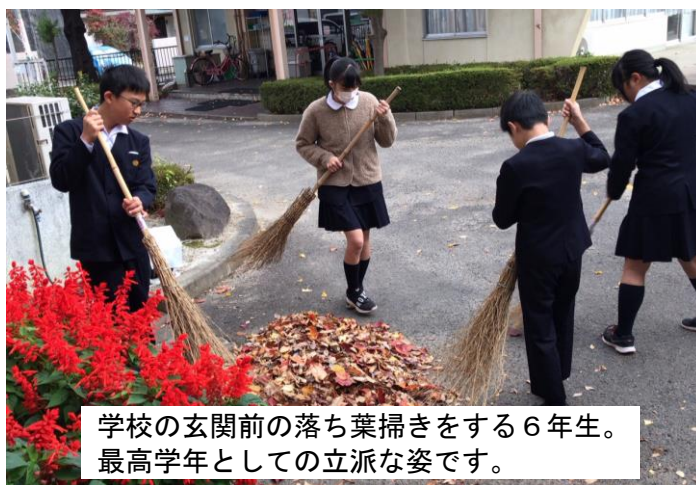
学校の玄関前の落ち葉掃きをする6年生。 最高学年としての立派な姿です。

これまでの6年生がやってきたように、今年の6年生も学校をしっかりと綺麗にしようとする態度が素晴らしいです。まさに、伝統を引き継ぐ立派な姿です。下級生にもこうした6年生の姿を模範としてほしいと思います。