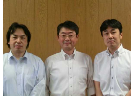
校長：野木勝弘 教頭：氏家博行 主幹教諭：吉川卓央