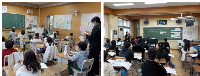
【子供たちは学びに夢中】