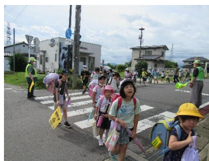
【毎朝居てくださる見守りの会の方々】

※ 学校での子供達の学びの様子を、余目小HPにアップしております。ご覧ください。