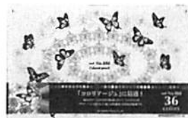
副賞の三菱鉛筆色鉛筆 No.888<36色セット>