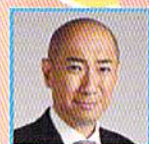
熊切大輔 日本写真家協会会長