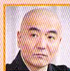
玄侑宗久 作家 / 撮影寺住職