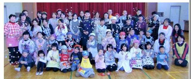
【完成した「団子さし」を持って、みんなで記念撮影！！】