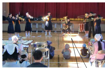
【演奏発表！！ 上手でした！！】