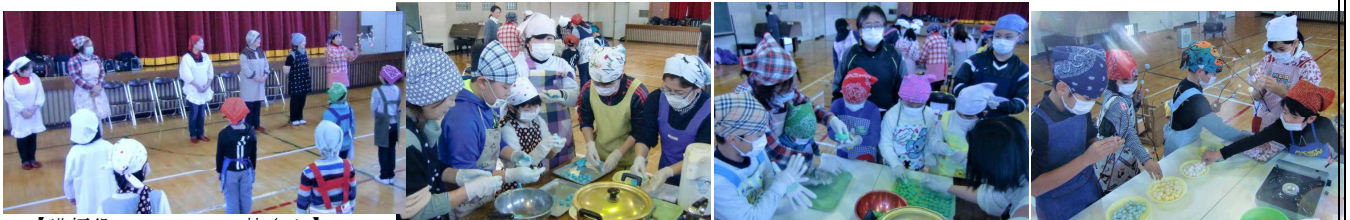
【講師役のPTCAの皆さん】

途中、いわきから県大会のため訪れていた、中学生の吹奏楽アンサンブルチームの演奏も披露され、目にも舌にも、そして耳にもおいしいひとときとなったようです。