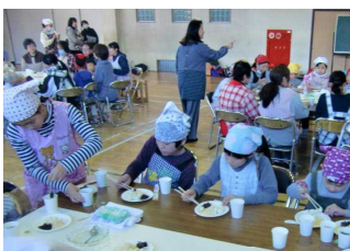
【あんこ・きなこ食べま〜す】