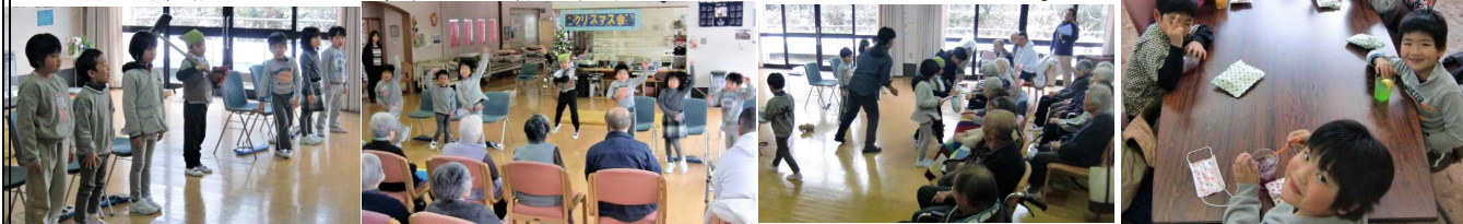
【きちんとあいさつできました】 【おむすび こころりん すっとなん】 【プレゼントをいただきました】 【ジュースもいただきました!!】

12日(火)、小雪のちらつく中、1年生が「けやきの村・ももの里」を訪れました。この週はももの里のクリスマス週間ということで、室内にも飾り付けがなされ、ちょっとしたパーティームードに包まれていました。1年生は、おじいちゃん・おばあちゃんの前で、学習発表会で演じた「おむすびころりん」を熱演。劇中のよさこいも全部踊りきるなど、元気一杯の発表をプレゼントしてきました。