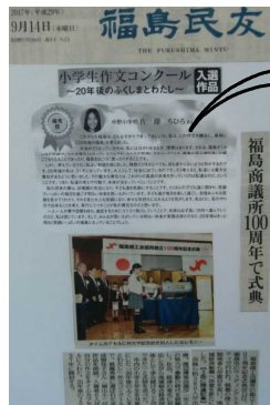
【新聞にも載りました】