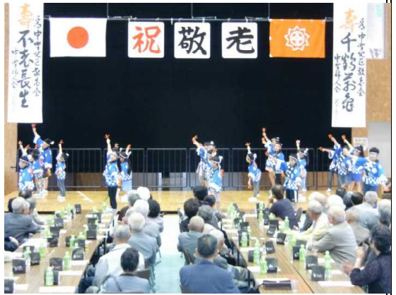
【「よさこい」キメのポーズ。決まったかな!?