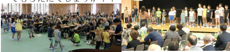
【手作りメダルをプレゼント】

16日(土)、飯坂支所で「中野地区敬老会」が開催されました。こぶしっ子達もお招きを受け、100名近くのおじいちゃん・おばあちゃん達の前で「よさこい」と「合唱」を披露してきました。みなさんに喜んでもらえたでしょうか!?