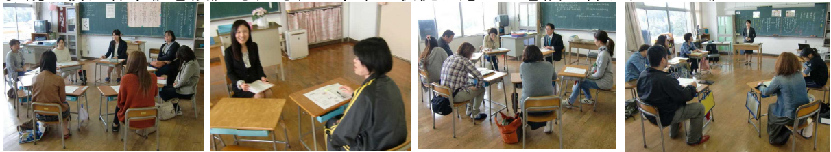
【1年生、まずは自己紹介から】 【2年生は1対1…楽しく歓談!】 【3・4年生は中堅学年のポイントを】 【5・6年生は、今年一年の動きを】

* その後は図書室にてPTA全体会。4月から加わった先生方の自己紹介や今年の目標(!)発表。その後、2月に行われた総会を基に本年度の各種計画などが改めて説明され、本年度の事業が本格的にスタートしました。