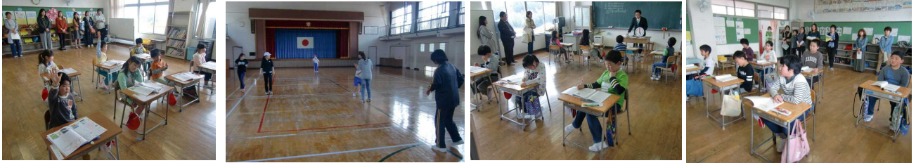
【1年生、みんなしっかり手を挙げ…】【2年生は親子参加型…お疲れ様でした】【3・4年生は算数、頑張りました】【5・6年生は道徳。リーダーとは!?!】

21日(金)、授業参観が行われました。お忙しい中、全ての児童のおうちの方がご来校されました。本当にありがとうございました。