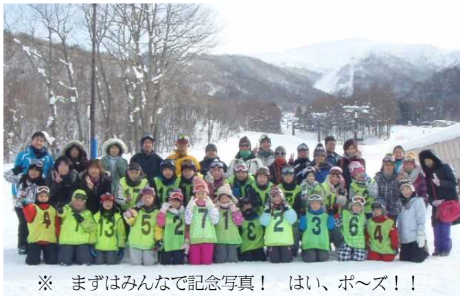
※ まずはみんなで記念写真！ はい、ポーズ！！

20日(金)、「箕輪(みのわ)スキー場」にて『ゆきのつどい』を行いました。心配していた天気も持ち直して、吾妻連峰がくっきり見えるスキー日和。また、インフルエンザやかぜの具合も乗り越え、児童22名に、保護者・PTCAのみなさんと、総勢44名が全員そろっての出発となりました。