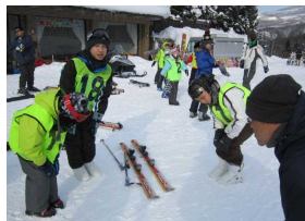
※各班ごとに準備体操