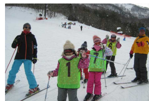
※ゲレンデにしゅっぱ〜つ！！