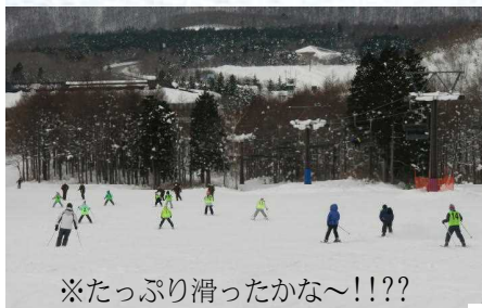
※たっぷり滑ったかな〜!??