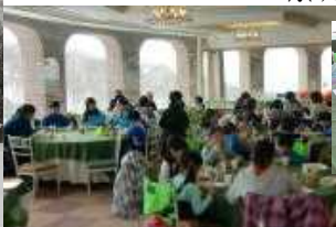
※昼食のカレーはおかわり自由！！