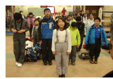
※今日はお世話になりました！！