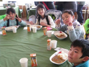
※みんな、おいしいね！！ こっちがメインだったかも!?