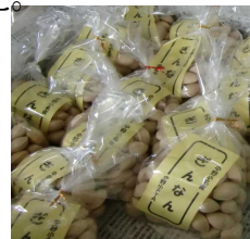
【中野小ブランドです!!】