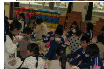
【みんなで会食。おかわりもスゴかった!!】