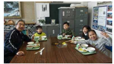
【左:全校給食…いい感じです。上:校長室ランチ(1年・2年)】