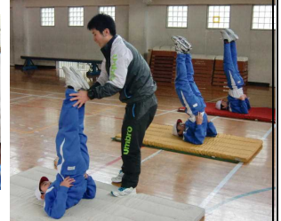
【マット運動…足を伸ばして!!】