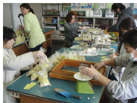
【1袋150g…放射線検査も合格】