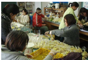
【袋詰め…皆さん鮮やかな手つきで】

完成した約200袋のぎんなんは、美人販売員のポスターとチラシとともに、まずは地域の方優先に販売を開始しました。