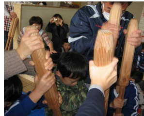
【もちつき頑張りました!】

12/1(木)、おおとり幼稚園の招待を受けた1・2年生が、「もちつき交流会」に参加してきました。園児や飯坂小1年生と一緒に餅つきをし、つきたてのお餅を食べ、しっかり交流してきました。