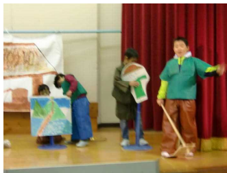
【3・4年：「わらしべ長者」 衣装や小道具もできあがり、雰囲気も出てきたようです。出来が楽しみ!】