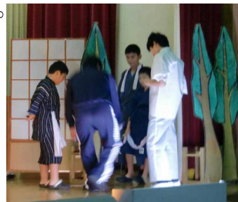
【5・6年「貧乏神物語」 大道具や小道具の配置、動きやセリフの具合など、みんなで話し合いながら進めていました。さすが!!】