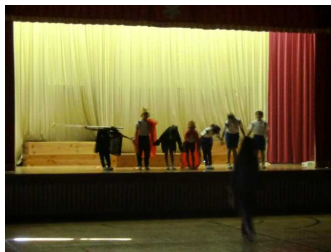
【1・2年：「眠れる森の美女」 セリフも覚えてきて、少しずつ合ってきたようです。間違えずにできるかな!】

あと1週間あまりに迫った「学習発表会」。各学年とも一生懸命練習に取り組んでいます。…が、先生方も、児童のみんなも、けっこう口が堅くて、なかなかその練習状況が伝わってきません。体育館で行われている極秘練習に潜入(!!)し、偵察してきました。