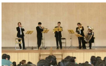
【↑ステージの上でも下でも…】

26日(水)、飯坂小学校にて鑑賞教室が行われました。今回は「金管五重奏団」による音楽鑑賞でした。おじさん五人組(!?)による楽器演奏で様々な曲を聴き、楽しいひとときを過ごしてきました。