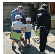
【お客さんへインタビューも!!】