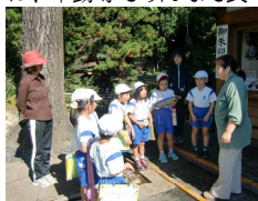
【お寺の方から説明を聞きました】