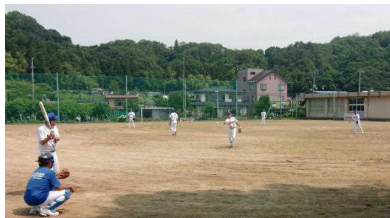
まずは学校で早朝練習!!

19日(日)、十六沼公園グラウンドで、毎年恒例のソフトボール大会が行われました。我らが中野チームも11人の精鋭がそろい、大会に臨みました。