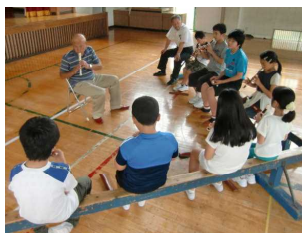
笛でお囃子の節回しを復習...