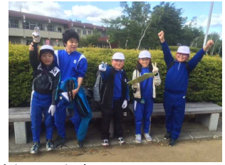
オリエンテーリングも頑張りました。