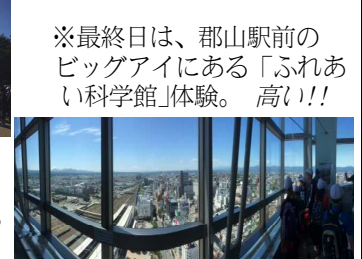
※最終日は、郡山駅前の ビッグアイにある「ふれあ い科学館」体験。高い！！

みんないい顔で活動していたようです。一方、上級生の留守中、校舎の中はちょっと寂しいものがありました。やはり、いるべき人たちがいないと、その部分にぽっかり穴があくものです。でも留守部隊もしっかり学校を守ってくれていました。特に4年生たちは、朝の登校から先頭に立ち、下級生の様子に気を配りながら先導したり、授業や諸活動できちんと生活する姿が見られていました。さすがです！！