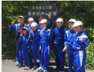
登山は強風で残念ながら中止。代わりにハイキング。