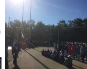
※3日間、 天気は 最高でした。