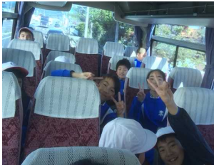
行きのバス中。元気一杯です。

本日、5・6年生が2泊3日の宿泊学習から戻りました。現地からもいち早くスナップ写真が送られてきたので、その活動の様子をいくつか紹介します。