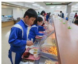
お楽しみの食事タイム。館内も野外もおもしろそう！！