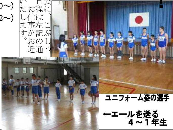
ユニフォーム姿の選手