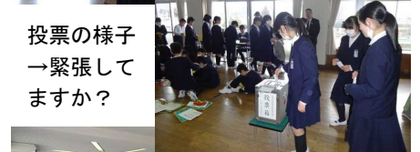
投票の様子 →緊張しますか？