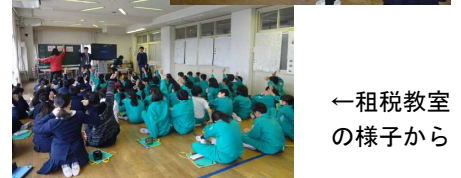
←租税教室の様子から