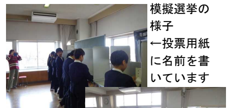
模擬選挙の様子 ←投票用紙に名前を書いています

5年生も社会科 でJR東日本の方を講師として、身の回りのたくさんの情報はどのように管理されているのかをJR東日本という会社の仕事を通して、情報伝達について学習しました。たくさんある情報から必要なものを的確に確実に素早く伝えるにはどうすることが必要でしょうか。国語科にも通じるとても重要な学習