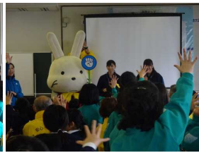
認知症サポーター養成講座の様子から←

○ フッ化物洗口について、小学校では実施しないのでしょうか？ <保護者アンケートより>