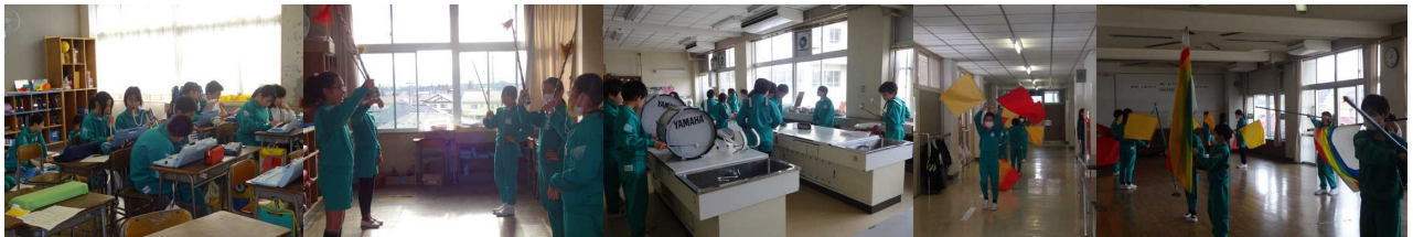
それぞれのパートで練習です(フラッグ・指揮・太鼓・鍵盤)毎日の練習でどんどん上達しています

今年度も鼓笛隊の引き継ぎが始まりました。5年生は、6年生から鼓笛を受け継ごうと頑張って練習を重ねています。6年生もそれぞれの楽器等を5年生に引き継ごうと一生懸命教えています。まさに、伝統の継承。「ありがとう」「よろしく」の気持ちを忘れずにもち、相手に伝えられるようにして行って欲しいと願っています。