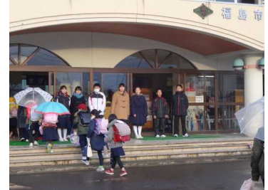
今年最初の合同あいさつ運動。 寒さに負けず頑張ってます。

子供たちは、インフルエンザにも負けずに3学期を頑張ってきましたが、1月末から、インフルエンザの流行の兆しが大きくなりました。また、感染性胃腸炎を疑う症状も急激に増え、一つの学級が学級閉鎖となるなど、ご迷惑ご心配をおかけしております。今後も、情報伝達をいたしますので、予防や早期対応へのご協力をよろしくお願いいたします。学校もできる予防を行って乗り切りたいと思います。