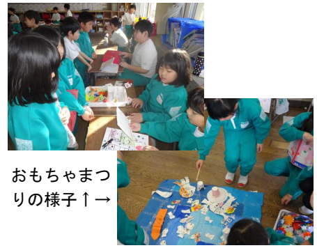
おもちゃまつりの様子↑

2年生 は、延期されていた「おもちゃまつり」を 1年生 を招待して無事に行いました。手作りおもちゃや練習してきたプレゼンの成果を発揮して、1年生を楽しませることができました。1年生はたくさんのおもちゃに迷いながら、ニコニコと遊んでいました。2年生になると、こんなことができるようになるんだな～というお手本でした。