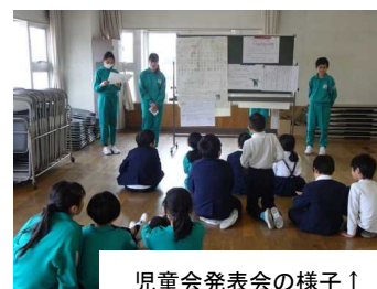
児童会発表会の様子↑

児童会委員会発表会 がありました。2月19日（水）20日（木）昼休みの時間を活用して、ワークショップ形式で、自分達の委員会の1年間の活動報告をしました。それぞれの委員会で頑張ってきたことを全校生に報告し、よいところを引き継いでいってほしいと思います。また、下学年の皆さんは委員会活動をして平野小学校を盛り立ててくれた5・6年生に感謝の気持ちをもって「ありがとう」を伝えてほしいと思っています。新たな学年に向けての準備が進んでいます。