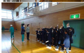
クラブ見学会の様子（3年）↑↓

1年生 は、来年度小学生となる 幼児を招いて交流会 をしました。（2月18日）交流したのは、ひらの認定こども園と平野保育所の年長さんです。それぞれの名札を作って各学級へ案内をした後は、準備してきた「おしえてあげよう」「いっしょにあそぼう」を楽しく行いました。4月になると2年生となって、さらに小学校のことを教えてあげるようになりますね。近くで2年生が『小さい子はかわいい！』と言ってとてもうらやましようにみていました。1年生も2年生も新年度からよろしく願います。