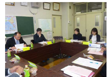
↑ 熱心な協議の様子から