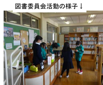
図書委員会活動の様子↓

クラブ活動見学会 がありました。クラブ活動もまとめです。3年生は次年度からクラブ活動に参加します。そこで、各クラブを見学して自分の参加したいクラブを決める参考にしました。「どのクラブ活動も楽しそう！」という感想が聞かれました。4年生になったら、自分が入りたいクラブに参加して楽しく活動してほしいです。料理・手芸クラブではお手製のカナッペをご馳走になったようです。