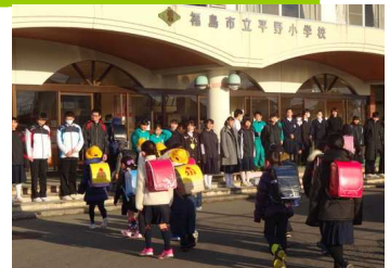
合同あいさつ運動↑ 中学生のみなさん 1年間ありがとうございました

最後の授業参観も実施できず大変申し訳ありませんでした。どうぞご家庭での見守りをよろしくお願いいたします。