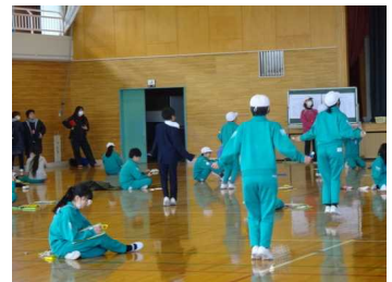
なわとび記録会から（6年↑・4年↓）

保護者の皆様には寒い中で応援をいただきありがとうございました。子どもたちの励みになっておりました。