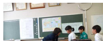
校長室の課題は？オリエンテーリングから↑↓