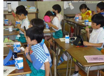
歯みがき指導↑演劇鑑賞↓