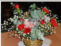
花育でいけました（3年）