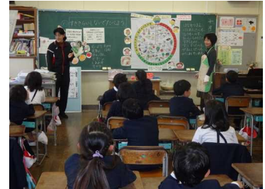
食育の授業風景（2年）

朝早くから学習発表会においでいただきまして、ありがとうございました。どの学年も、どの子供も自分の役割をもち、先生と友だちと一緒に今まで学習して練習してきた成果を十分に発揮し、発表できたと思っております。衣装等の準備をしていただき、さらに、応援していただきありがとうございました。保護者の皆様、地域の皆様にご覧いただき、「よかったね」「おもしろかったね」「上手にできたね」等、認めていただけることが何よりもうれしく自信につながるものと思います。子どもの感想からも『褒めてもらえてうれしかった。』『100点満点だ』という満足感ある感想も出ています。今後も認めていただく声かけをどうぞよろしくお願いいたします。ありがとうございました。