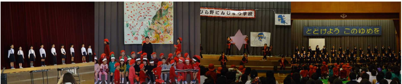
1・2・3年生の一コマ↑ 4・5・6年生の一コマ↓から

朝早くから学習発表会においでいただきまして、ありがとうございました。どの学年も、どの子供も自分の役割をもち、先生と友だちと一緒に今まで学習して練習してきた成果を十分に発揮し、発表できたと思っております。衣装等の準備をしていただき、さらに、応援していただきありがとうございました。保護者の皆様、地域の皆様にご覧いただき、「よかったね」「おもしろかったね」「上手にできたね」等、認めていただけることが何よりもうれしく自信につながるものと思います。子どもの感想からも『褒めてもらえてうれしかった。』『100点満点だ』という満足感ある感想も出ています。今後も認めていただく声かけをどうぞよろしくお願いいたします。ありがとうございました。