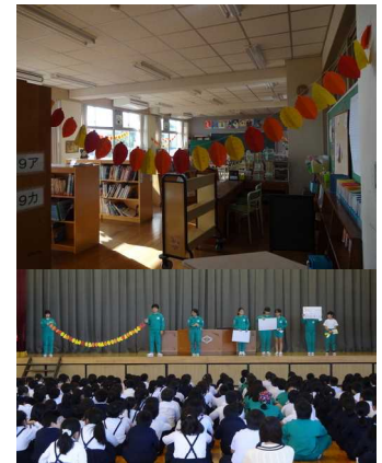
図書館を飾っているおすすめの本の葉↑と 図書委員会の発表の様子↓

図書委員会 は全校集会で「 読書週間 」についての アピール をしました。また、図書委員の児童が1・2年生の教室に出向いて、「読み聞かせ」をしてくれています。図書室には、全校生のおすすめの本が書かれた葉がならんで紹介されています。読書の秋、ぜひご家族で本を読む時間をとってみませんか。家の中に漫画や雑誌以外の本がありいつも読める環境にある家庭、家族で本を読むという環境は子どもの勉強の意欲向上にはとてもよい環境とされています。