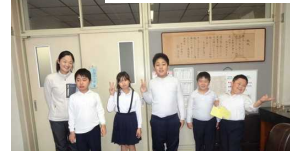
感謝の気持ちを伝えた皆さん↑と保健委員会の皆さん↓