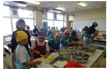
ジャム作りの様子(3年)

ひらのこども祭り が盛大に開催され、たくさんの子どもたちが楽しいひと時を過ごしました。16日(土)PTA主催で平野地区世代間交流事業として開催されました。子ども達は学校の行事とは違う行事を楽しそうに味わっていました。保護者の皆様、多くの地域の方々に参加ご協力をいただきました。ありがとうございました。