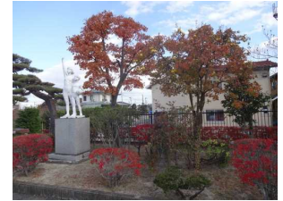
紅葉の庭木-かりんの実がたわわです