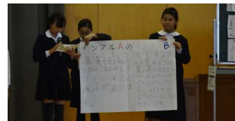
火育のマッチの使い方コーナーの様子