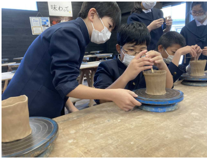
慶山焼 湯呑み作り