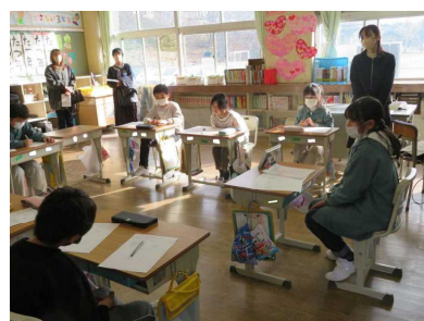
3年学活「6年生に感謝の気持ちを伝えるためにどんなことができるか話し合おう」