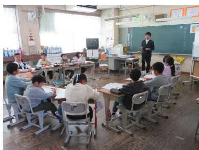
4年道徳「わたしのいのち」