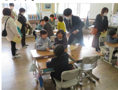
2年算数「1000より大きい数をしらべよう」