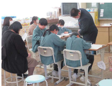
5年道徳「まんがの神様」