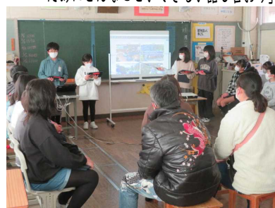
6年総合「下川崎で生きる」