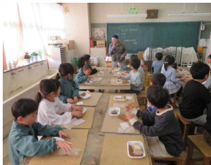
1・2年木エクラフト