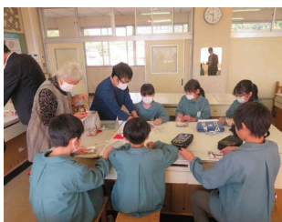
5年つるしびな製作