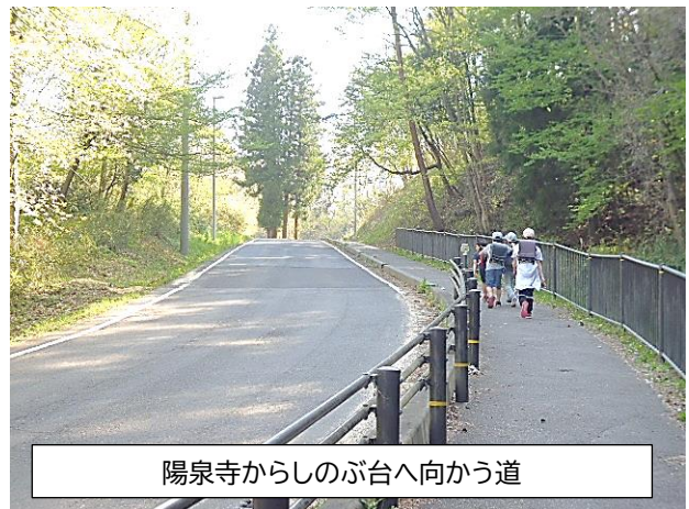
陽泉寺からしのぶ台へ向かう道

現在、教育委員会から借りたクマよけの鈴をつけて登下校しています。今後、通勤時や作業時など、子どもたちの登下校の様子を見守っていただけると大変ありがたいです。学校、家庭、地域で、子どもたちの大切な命を守っていきたいです。