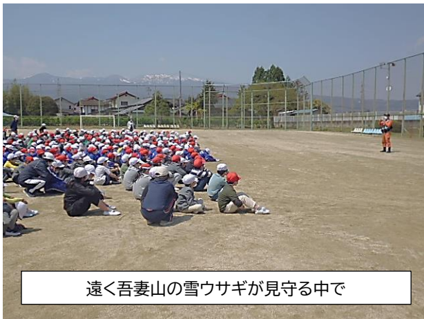
遠く吾妻山の雪ウサギが見守る中で

消防署の方のお話がありましたが、子どもたちの聴く態度がとても素晴らしく、大変気持ちよかったです。