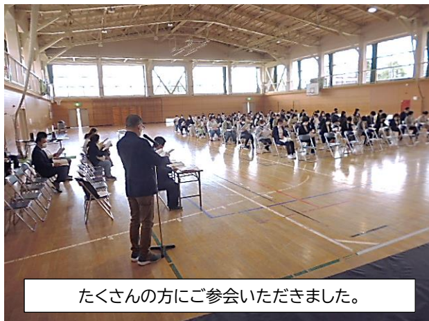
たくさんの方にご参会いただきました。

鳥川小学校父母と教師の会総会が開かれ、まだコロナ禍ではありますが、今年1年、父母と教師の会のメンバーみんなて結束して盛り上げていきたいと思ひます。