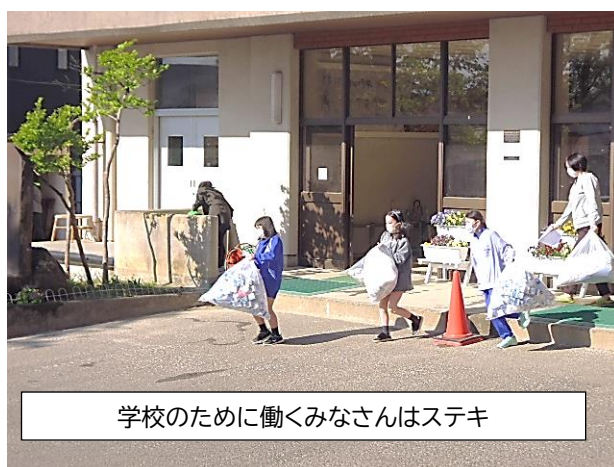
学校のために働くみなさんはステキ