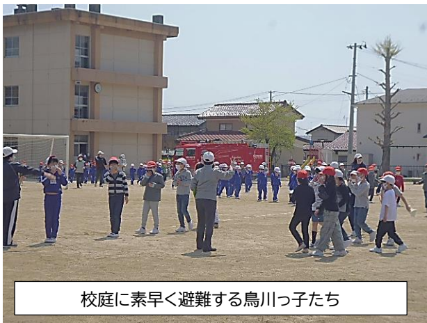
校庭に素早く避難する鳥川っ子たち

消防署の方のお話がありましたが、子どもたちの聴く態度がとても素晴らしく、大変気持ちよかったです。