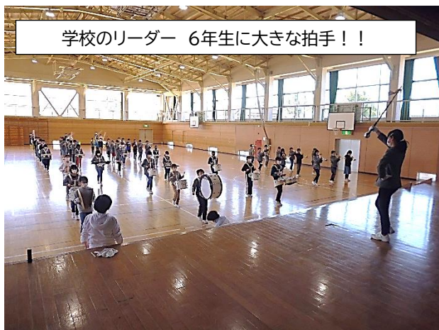
学校のリーダー 6年生に大きな拍手！！

緊張の年度初めから1ヶ月が過ぎ、子どもたちの表情もだいぶ柔らかくなつてきました。