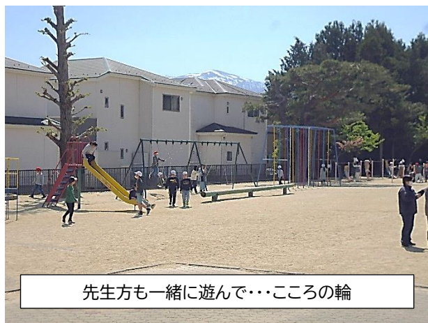
先生方も一緒に遊んで・・・こころの輪

6年生は鼓笛の練習に力を入れています。学校の代表として堂々と行進できるように、昼休みの時間でも心ひとつに練習している姿は、さすが鳥川小学校の6年生。応援していますよ。