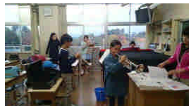
【4年生；音楽の力】【5年生；フィジカル エデュケーションミュージアム】【特設音楽；ひまわりの約束】