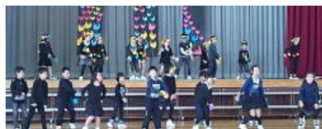
【1年生；おむすびころりん】【2年生；おいしいうどんをつくりましょう】【3年生；花さき山】