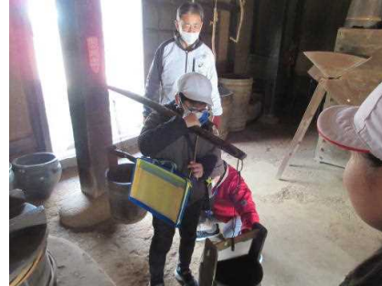
旧阿部家のリビングは床板なしの土座(どざ)!井戸から水をくみ上げて家に運ぶんだ(^.^)手桶をつるした天びん棒ってけっこう重たいね(^.^);)