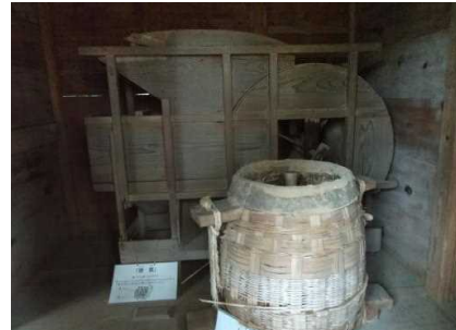
ここは板倉(いたくら)といってもみを保管する場所(^.^)千歯こきや唐箕(とうみ)といってもみやわらと米を分ける道具を発見したよ(*^▽^)