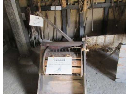
旧奈良輪家でアイロンの先祖を発見!昔はこてや火のし(炭火を入れた器)で布のしわ伸ばしをしてたんだね(^.^)貴重な農具もたくさんあったよ!