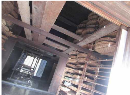
旧小野家は養蚕農家~(^.^)繭を煮るかまどと蚕架(さんか)といって蚕を育てる平らな竹かごを並べる棚専用の部屋を発見したよ(^.^)