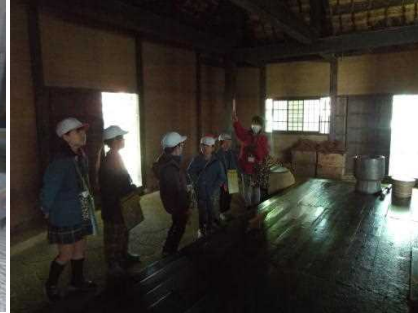
旧馬場家は馬屋中門造といって人と馬が一つ屋根の下に暮らしてた家なんだ(^.^)農耕馬は大切に扱われてたんだね(^.^)中に入ると土間が広すぎ~(*^▽^)