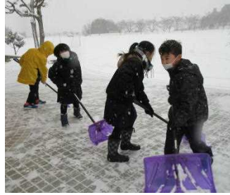
「気づき、考え、実行する」児童が自主的に雪かきをしてくれました。

1月19日(木)に第3回学校運営協議会が行われた。今年度の学校の概要を説明した。委員の方々からは、子どもたちが生き生きと学んでいる様子を送り続けた教育のほしいと、多くの方々の意見をいただきました。今後、飯野町ならではの教育を進めて行きます。