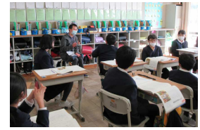
5年生の道徳授業に保護者の方々が参加してくださいました