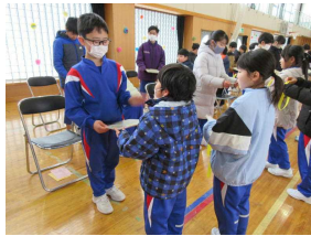
在校生から6年生へ感謝のプレゼント