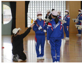
飯野小鼓笛隊の伝統をしっかりと受け継ぎました。