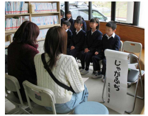
2年生は地域の方から教えていただいた飯野の民話を発表しました