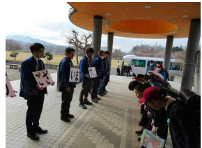
始業式の日には青年会議所の方々があいさつ運動に来てくださいました

始業式では、登校をした際に自分の靴だけでなく友達のを並べている児童がいたことを話しました。この行動は、本校の3つの合言葉「あいさつ、歩行、くつそろえ」、教育目標「気付き、考え、実行」を実践している素晴らしい姿であると話しました。