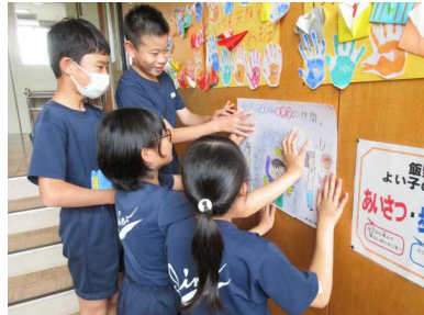
いじめ防止ポスター掲示