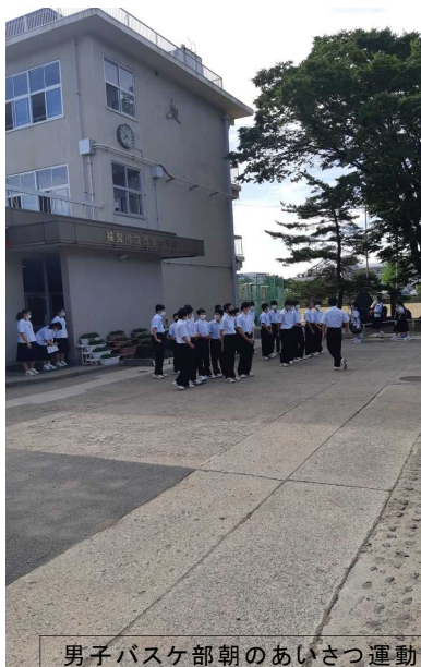
男子バスケ部朝のあいさつ運動