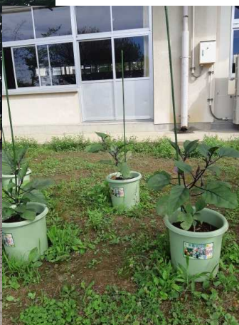
1年生技術の作品（なす）