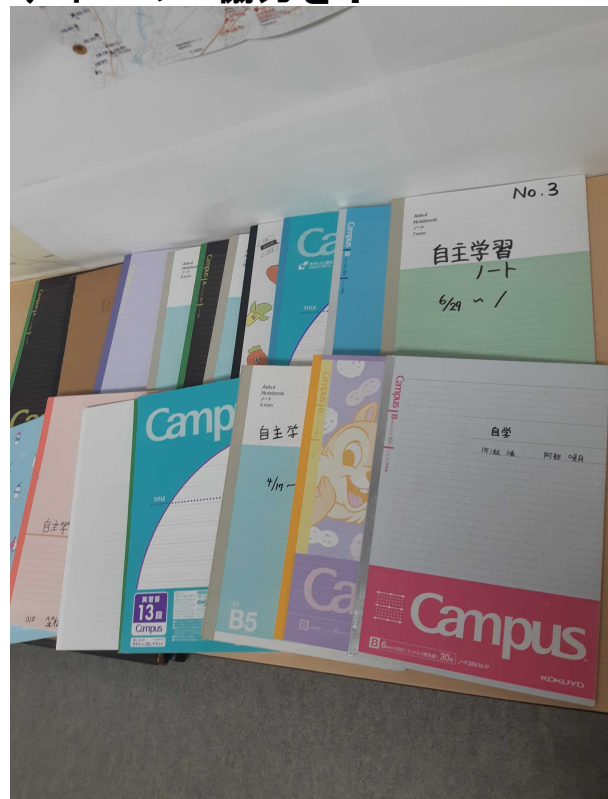
本日の1年1組自主学习ノート。毎日提出されます。