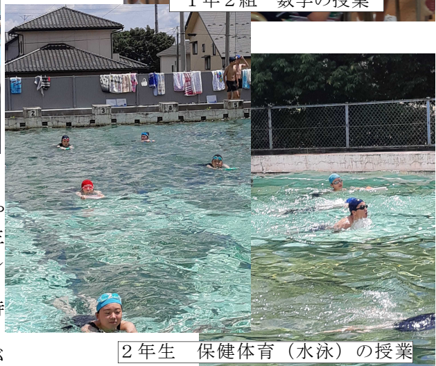
2年生 保健体育(水泳)の授業

このことについては、ご家庭の果たす役割が大きいです。お子さんと正しい使用法やルールについて話し合っていたいただきたいと思います。