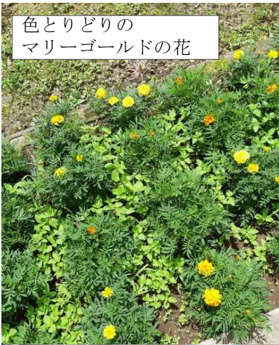
色とりどりの マリーゴールドの花