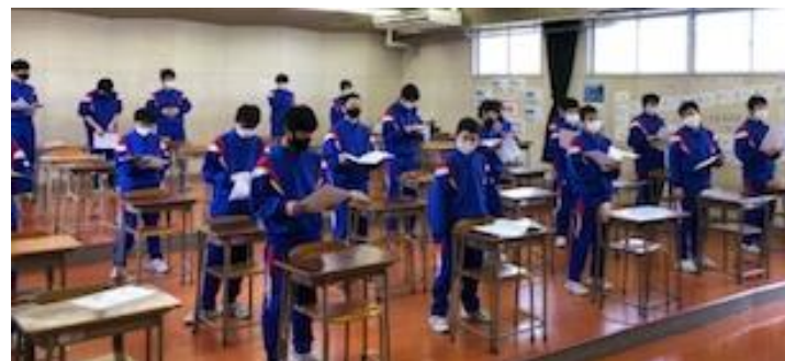
3年男子の歌声をお手本に1年男子の式歌練習