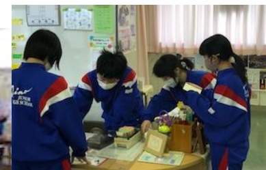
図書委員会の図書の貸出